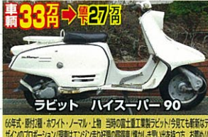
66年式・新付排気管・ホワイト/ノーマル・超極上 当時の富士工業製!フロント!今!も!超極上!超極上!超極上!超極上!超極上!