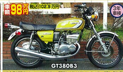
73年式・国内新規3年・イエロー/オリジナルライン・元塗装タンク付・3本誌ノーマルマフラー 超極上 弊社で整備完了の、GT380B3イエロー外装を眺めたこの満更を見よ!これ程の良車なのは、弊社仕上りなので、ご来店前の良!