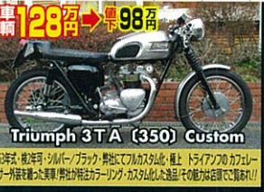
Triumph 3TA (350) Custom

65年式・軽二輪登録・フルカスタム/オリジナル塗装・コンチアプター付・超極上! 意欲の湧き上がる美車!!