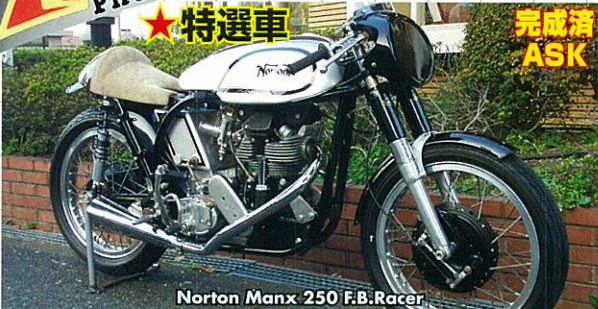
Norton Manx 250 F.B. Racer

★買取車の査定は、愛車を売るあなたの立場に立ち、適切な評価と誠実さを信条とする、タイムトンネルへ!!