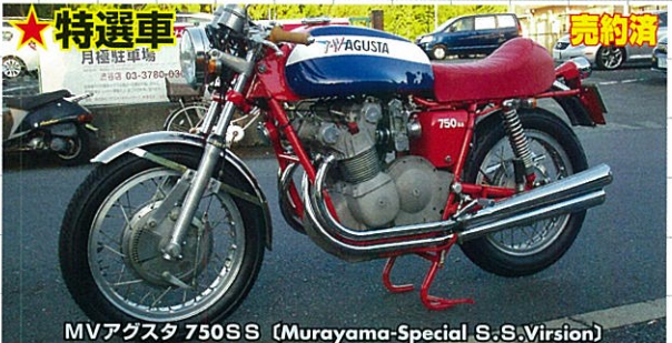
MVアグスタ 750 S.S. (Murayama-Special S.S. Virsion)

年式不明・本物Manxベースのフランス製(オートレーシングカスタム・レーシングマフラー・超極上(受注により、公道仕様も改造可))知る人ぞ知る、有名なNortonManxワークスの、フランス製(オートカスタムがこれ! 威圧的な戦闘力ルックス、純粋なレーサー!)選に、ここに完成!!