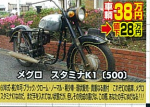
メグロ スタミナK1 (500)

69年式・軽二輪登録・レッド/クローム・元塗装・オリジナル・超上! クラシックスタイルの初期型MK-III! 意欲の湧き上がる美車!! 意欲の湧き上がる美車!! 意欲の湧き上がる美車!!