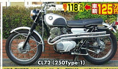
65年式・軽二輪登録・シルバー・ノーマル・極上 原価720Type-1は極めて少ない!それにエンジンがまともなものを、探すの大変!好買であるならば、HONDAの名車の感覚を味わえる!!