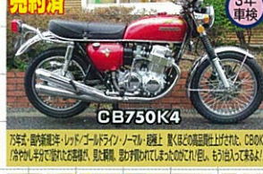
75年式・国内新規3年・レッド/ゴールドライン・フルノーマル・超極上 知名度は上げた!CB750K4!超極上!超極上!超極上!超極上!超極上!超極上!超極上!超極上!超極上!