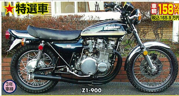
74年式・国内新規3年・ブルー/ゴールドライン・ブラック集合管付・超極上 優雅な25カラーのZ1は、弊社整備済みの高品質車であり、この度やっと店頭へお見え!IT.Tは全てのバイクを、お客様に納得すべく購入頂くのが他業!