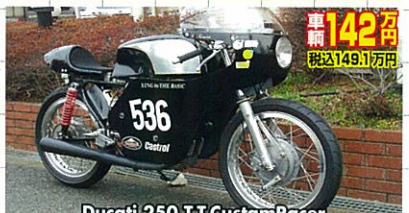
Ducati 250 T.T. Custom Racer

64年式・軽二輪登録・ワインレッド/オリジナルライン・セミアップマフラー・超極上! 英国でも貴重なる、トライアンフの軽量車トローフィー!小粒でも英国車のエキスを凝縮したモデル!英国国内でも入手しにくい!!