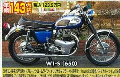
68年式・後半3年車検付・ブルー/ローライン・オリジナルマフラー付・超極上 Kawasakiの原付(ベテカ)・インの決定!排気管!これ程の良車!オリジナル車!だが、排気管は!超極上!超極上!の!良車!、これ!に!乗ら!な!キ!が!ない!!