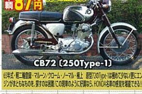
65年式・軽二輪登録・マウン/クローノ・ノーマル・超極上 原価720Type-1は極めて少ない!それにエンジンがまともなものを、探すの大変!好買であるならば、HONDAの名車の感覚を味わえる!!