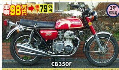
73年式・国内新規3年・フルノーマル・極上 このサンパフは、まともなバイクが絶滅してしまっただけか?と思わせる!やっど1台見つけたもので整備完了、今店へ!!