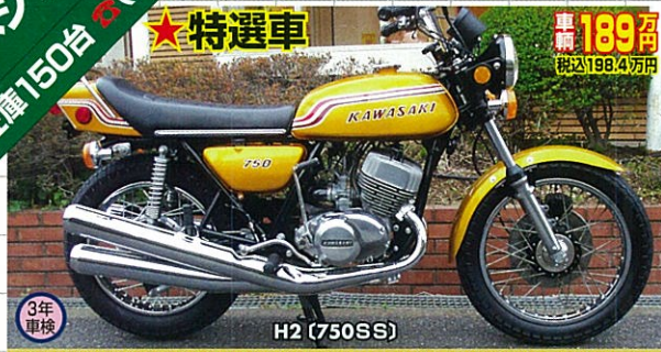
72年式・新規3年車検・ゴールド/オリジナルライン・フルノーマル・超極上 華麗な金のカラーを身にまとったH2美麗車登場!H2の中では別格の、珍しいほどオリジナルの原形を保った現車にこれを見ないで、逃す手はないよね!!