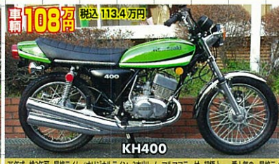
75年式・後半年 最終タイム/オリジナルライン・3本誌ノーマルマフラー付・超極上 一番人気の、最終タイムシリーズ!H400良車!良車!何となく!この最終型でも!値目!と安い!と!良車!の!良車!