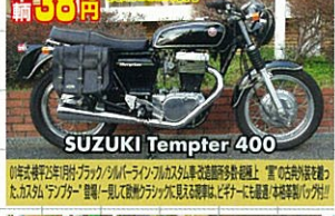
67年式・新規3年車検付・ブラック/オリジナルライン・フルノーマル・超極上 質の良さを味わう!550cc!ワー! 超極上!超極上!超極上!超極上!超極上!超極上!超極上!超極上!超極上!超極上!