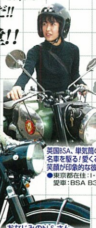
英国BSA、単気筒の名車を駆り!愛くるしい笑顔が印象的な彼女!! ●東京都在住: I・Hさん 愛車: BSA B31