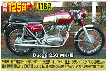
Ducati 250 MK-III

64年式・軽二輪登録・ワインレッド/オリジナルライン・セミアップマフラー・超極上! 英国でも貴重なる、トライアンフの軽量車トローフィー!小粒でも英国車のエキスを凝縮したモデル!英国国内でも入手しにくい!!