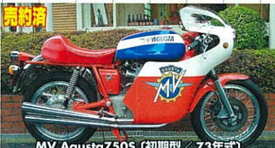
MV Agusta 750S (初期型 / 73年式)

73年式・後2年可、MVトリコロール色・オリジナル、クローム4本出しマフラー・超極上 あの名MVアグスタ750(初期型ドラムブレーキ)豪快で一番音が良いと定評の、クローム4本出しマフラー!何と何と4,000km美走の、エンジン絶好調の美車!世界的な稀少車なのだ!!