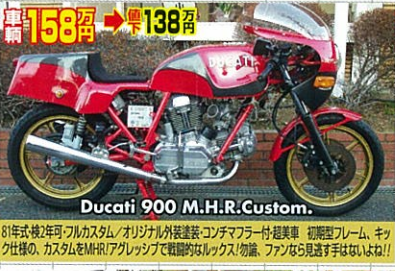
Ducati 900 M.H.R. Custom.

年式不明・軽二輪登録・ブラック/シルバー/フルカウル付・オリジナル・超極上! 改造済! 公道でも公道でも、タイムトンネルで2年2ヶ月のインコンクランを愛した、意欲の湧き上がる美車! 意欲の湧き上がる美車! 意欲の湧き上がる美車!!