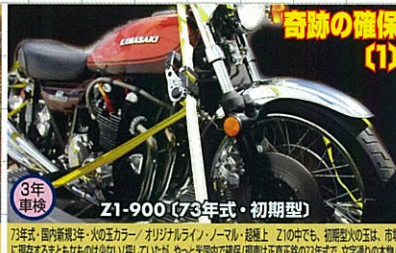
73年式・国内新規3年・火の玉カラー/オリジナルライン・ノーマル・超極上 Z1の中で、知名度火の玉は、市場に現存するまともなものは少ない!現!に!た!か、やっど!国内!で!販売!現車!は!正規!正統!の!73年式!、文字列の本誌!