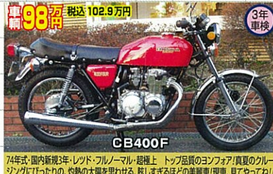
74年式・国内新規3年・レッド・フルノーマル・超極上 トップ品質のヨソフォア!真夏のクーリングにぴったりの、灼熱の太陽を思わせる、眩しすぎるほどの美麗車!現車、見てやて!!