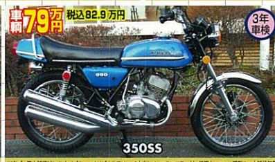
73年式・国内新規3年・スチール/オリジナルライン・本誌ノーマルマフラー付・超極上 マッパ系列の、中間排気量350SS良車!何となく、初心者でも乗りやすい!マッパはここぞで深くて!550cc!ワー!が、マッパ!さらさら!とノッポ!