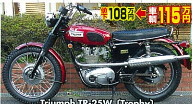
Triumph TR-25W (Trophy)

75年式など・後2年可・アグスタレッド・フルノーマル・レストアップ済・超極上! 最近市場に出なくなった貴重なるアグスタ350S!かつての輸入元、"村山"でレストアップした完璧な美車!!