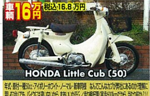
67年式・新規3年車検付・ホワイト/ノーマル・超極上 人気!人気!人気!人気!人気!人気!人気!人気!人気!人気!人気!