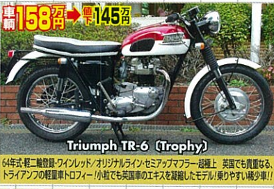
Triumph TR-6 (Trophy)

81年式・後2年可・フルカスタム/オリジナル塗装・コンチアプター付・超極上! 初期型フレーム、ベック仕様の、カスタムをMHR!アグスタレッド! 意欲の湧き上がる美車!!