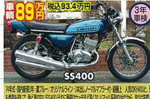
74年式・国内新規3年・ブルー/オリジナルライン・3本誌ノーマルマフラー付・超極上 人気!人気!人気!人気!人気!人気!人気!人気!人気!人気!人気!

求む!!バイク ★買取強化中:弊社から購入のバイク、及び旧車は、特に高価査定!! ★20年来のお客様が大量おられるからこそ、買戻しの旧車は、他店より高く買えるのです!!