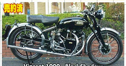
Vincent 1000 BlackShadow

77年式・国内未登録・アグスタレッド・トリブルディスク・本物の新車!! エンジン未点火の、30年前の新車!残念ながら弊社のお得意様にお買上げました。