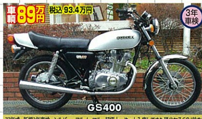
77年式・新規3年車検・シルバー・フルノーマル・超極上 やっと入庫してきた稀少なGS(前)の台は、即売約となつてしまつたため、責任感で探さなければ…と思つて!1予約の方面先です